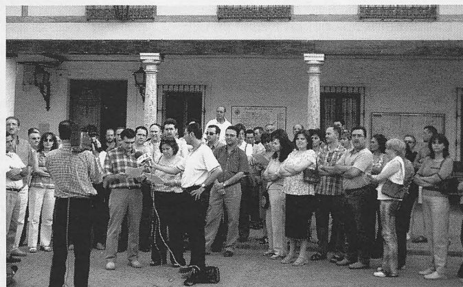
Los trabajadores entregaron un manifiesto en las oficinas del Inem. A la derecha, otra imagen de la lectura en la Plaza Mayor.