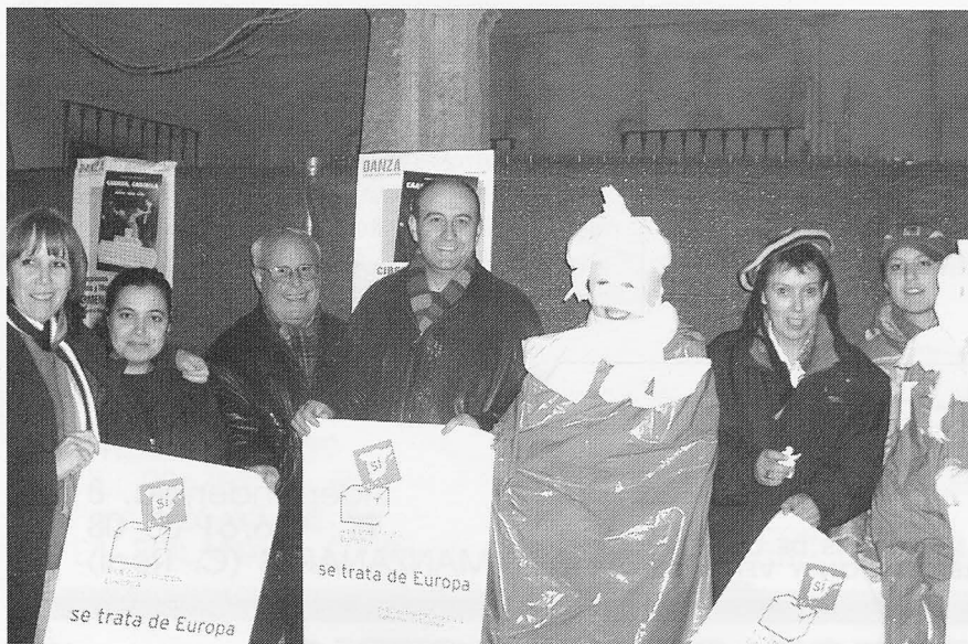
Sólo el PSOE hizo campaña, que comenzó en pleno carnaval.