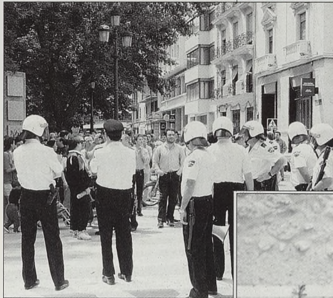
Un grupo de conqenses increpó a los asistentes a la fusión de las cajas.

Hablando de la prensa, leo en un periódico toledano que ha comenzado en