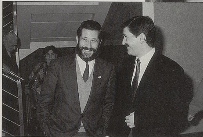
Francisco Ureña, presidente de la Diputación de Ciudad Real

Fuentes gubernamentales han insistido en su negativa a la incineradora; pero ya han pedido dialogar. El acto de fuerza del NO amenaza con convertirse en uno de debilidad y entra dentro de lo muy probable que la salida al asunto sea la que auguran algunos parlamentarios de la oposición: