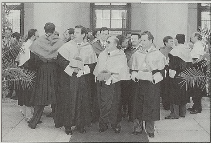
La ética y la política centraron la inauguración del curso universitario.