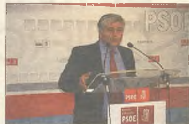
El diputado regional, Tierraseca

el Consistorio azudense se afirma que el municipio no disponía del terreno suficiente que requería la multinacional. En cualquier caso, la inversión, de 25 millones de euros, se va fuera.