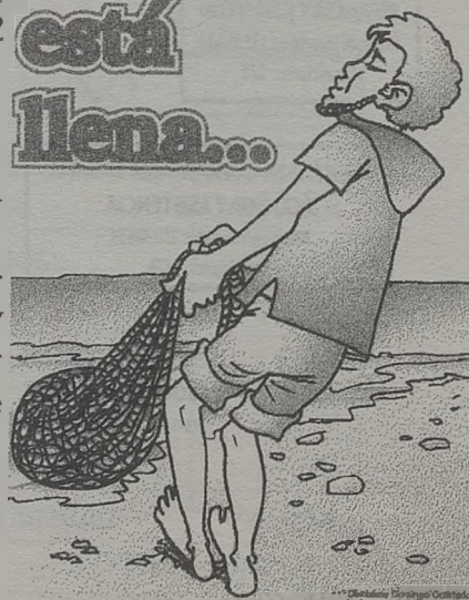
111r. Lectorio Domingo Ordinario 1987-88

En la vida no todo tiene la misma importancia. Existe una jerarquía de valores. Para el rey Salomón, lo importante es el don de la sabiduría para gobernar al pueblo (1 Lect.). Para Cristo es el Reino de Dios por el que se exige sacrificar todo (Ev.). Para Pablo es el plan salvífico de Dios que escoge, justifica y glorifica (2 Lect.).