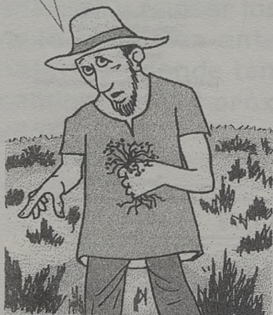
67. Lectorio Domingo Ordinario 1987-88

¿De dónde viene esto... Quieres que la recojamos?