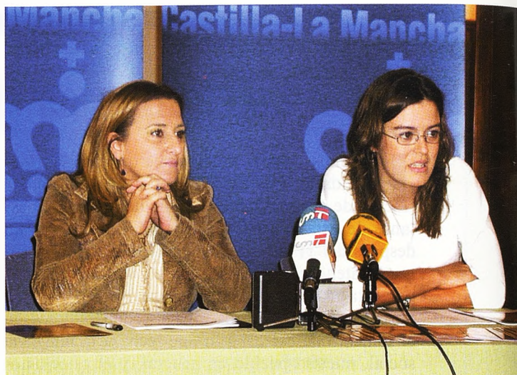
La Consejería de Cultura, Juventud y Turismo apuesta este año 2004 más fuerte que nunca por el proyecto de 'Jóvenes Cooperantes de C-LM' del que oferta 240 plazas.

El proyecto de 'Jóvenes Cooperantes' no se entiende sin las ONGs ya que son éstas las que en realidad acogen a los jóvenes voluntarios integrándoles en sus proyectos de cooperación