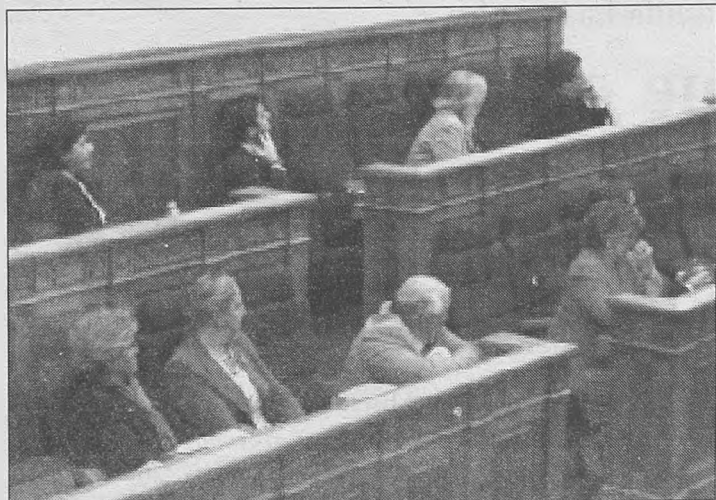
Imagen de algunos parlamentarios del Grupo Popular durante la sesión plenaria.

puntos a Castilla-La Mancha, pese a que en un buen número de ellos se hace referencia al déficit hídrico del Levante español.