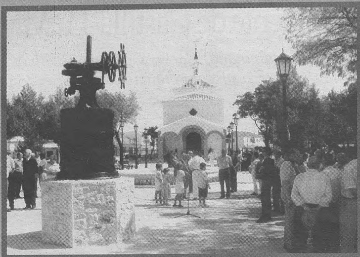
SOCUÉLAMOS. En honor al Santísimo Cristo de la Vega, esta localidad manchega viste sus mejores galas festivas del 9 al 15 de agosto. Sus caldos, su gastronomía, su casco antiguo, y sobre todo, unos ciudadanos hospitalarios, hacen que este rincón manchego sea de obligatoria visita.