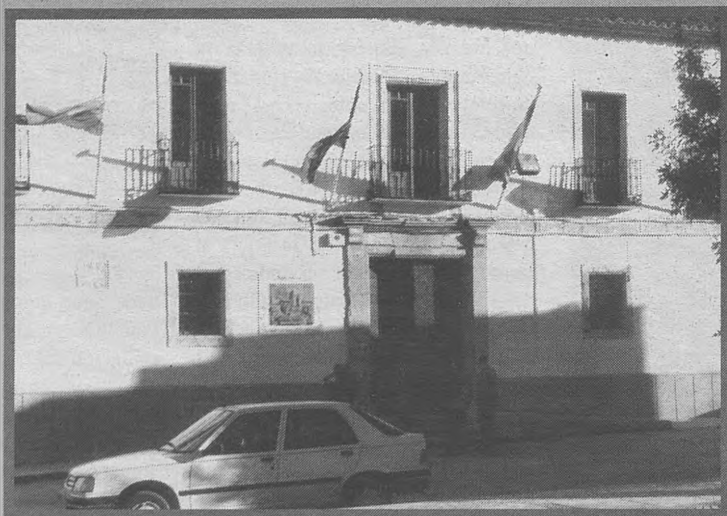
LAS PEDROÑERAS. La "capital del Ajo" muestra su principal producto al mundo del 26 al 29 de julio. Este año, en su XXXVI edición, volverá a impresionar a sus visitantes con el especial mimo que pone en sus trabajos, así como la hospitalidad de sus habitantes. En los primeros días del mes de septiembre, la localidad celebra su Feria y Fiestas.