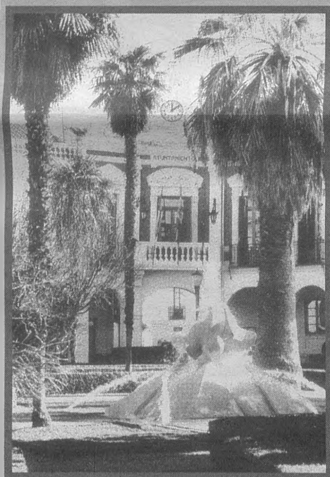
MANZANARES. Del 17 al 21 de julio, Manzanares celebra su tradicional Feria Regional del Campo y de Muestras, celebración que coincide con la Feria y Fiestas tradicionales de una población que es un auténtico "cruce de caminos" por su privilegiada situación estratégica.