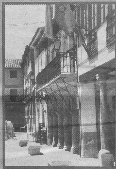
LA SOLANA. Cuna de la zarzuela y del esparto, es la población manchega donde el sol adquiere su máximo resplandor. Celebra sus fiestas en honor a Santiago y Santa Ana del 24 al 28 de julio, propiciando una espléndida oportunidad para visitar los tradicionales rincones de un enraizado pueblo manchego.