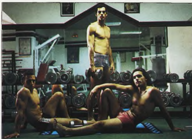
Las nuevas tendencias en moda de baño para hombre proponen unos bañadores versátiles para lucir tanto en la playa como en el gimnasio

de la tienda L'Uomo en Ciudad Real vuelve a proponer a los varones más atrevidos, unos bañadores hechos para que ellas vuelvan la cabeza en esas tranquilas caminatas por el paseo marítimo, modelos exclusivos, ajustados, cómodamente elásticos a caballo entre el "culotte" ciclista y el traje de baño, sujetos arriba por unos tirantes que han vuelto a