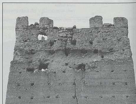
Fig. 14. Castillo de La Pileta de Cortes de Pallás. Vista de la zona superior de la cara frontal de la torre albarrana. En el espacio situado entre las dos almenas centrales se dispondría el cadalso, apoyado sobre los tres mechinales claramente apreciables. En el centro, un poco descentrada, la puerta de salida al dispositivo, tapiada con mampostería. Los espacios entre las almenas laterales aparecen también parcialmente tapiados con mampostería