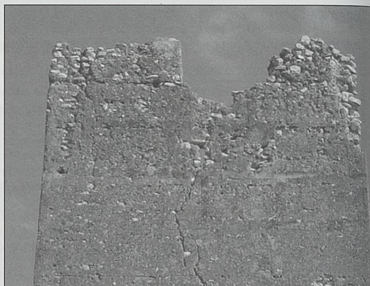
Fig. 11. Torre de Bofilla (Bétera) vista de la zona superior del lado oeste; muestra a la izquierda una de las jambas del vano central de salida a una buharda lignea; se conserva igualmente el mechinales izquierdo que soportaba una de las dos vigas que sustentaban el dispositivo