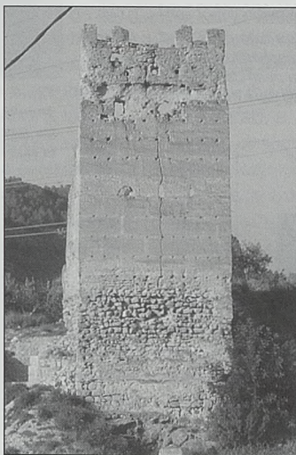
Fig. 13. Castillo de La Pileta de Cortes de Pallás. Vista de conjunto de la cara frontal de la torre albarrana con los indicios del dispositivo de madera en la zona superior