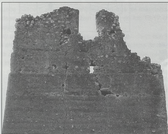
Fig. 10. Torre de Bofilla (Bétera). Vista de la zona superior del lado oriental mostrando el vano de salida a una buharda lignea cuyo suelo sostenido por dos vigas que se insertaban en los mechinales claramente visibles