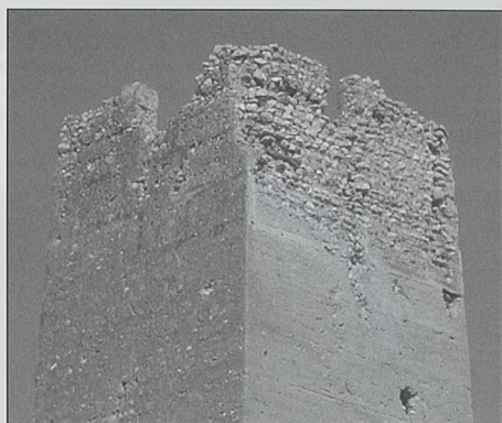
Fig. 12. Torre de Bofilla (Bétera) Vista de la zona alta del ángulo suroeste. En los dos lados visibles se observan los restos de los vanos de salida a las buhardas de madera que ocupaban la zona central de cada costado de la torre