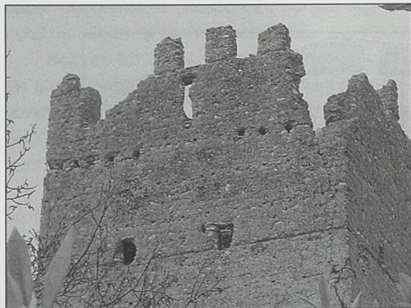
Fig. 7. Torre de Mussa (Benifaíó). Vista de la zona superior de la cara este. En este caso se han conservado varias de las almenas en el parapeto, por cuya base corren sendas hileras de mechinales en que se insertaban las vigas del suelo de los cadalsos o buhardas de ángulo. De nuevo, a la izquierda, puerta de salida a uno de los cadalsos