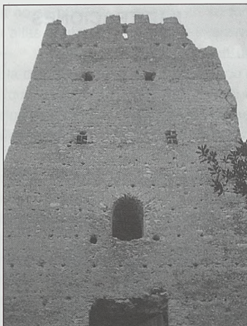
Fig. 8. Torre de Mussa (Benifaíó). Vista de conjunto del lado oriental mostrando abajo la puerta, los restos de la buharda que se le superponía (con arco de medio punto y dos mechinales para las vigas del suelo), dos pisos con saeteras reformadas y el coronamiento con el parapeto almenado y los indicios de los cadalsos a ambos lados