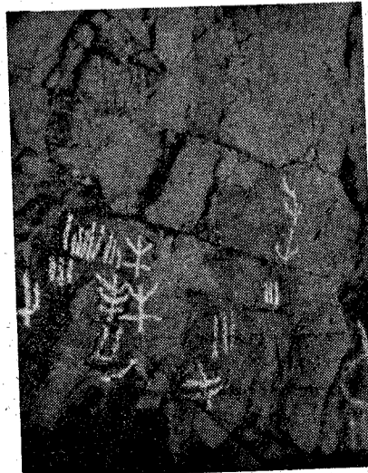
Pinturas rupestres en diferentes tonos de anaranjados y amarillos con abundancia de signos indeterminados, de la solana de las sierras de Puerto Alegre