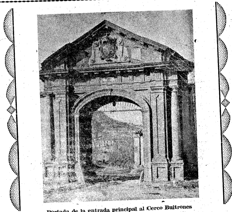
Portada de la entrada principal al Cerco Buitrones