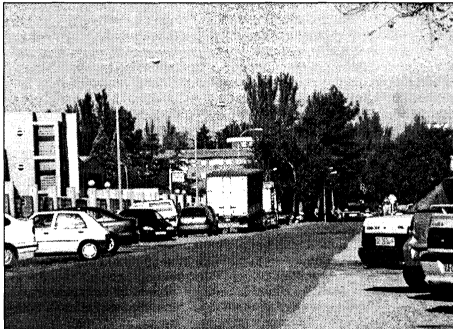
BCA ha elegido Azuqueca de Henares para fijar su sede en España.

Dada las características de la subasta, un mismo operador puede comprar y vender incluso en un mismo día, como si de una Bolsa del motor se tratase.