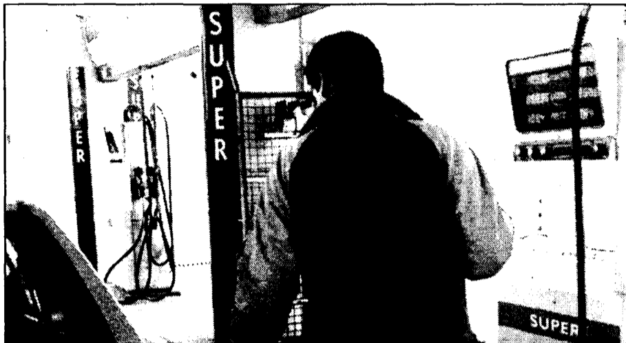
Los grandes depósitos de hidrocarburos se venden a gasolineras y gasocentros.

Las actuales instalaciones tienen una superficie de seis mil metros cuadrados, en las que se distribuyen las tres naves dedicadas a la fabricación de los depósitos en sus diferentes tamaños. Así, los depósitos estándares tienen una capacidad de entre 250 y 2.000 litros, siendo su destino principal los hogares; los dedicados a los gasocentros y cooperativas de agricultores, de 1.000 a 20.000 litros; y, por último, en calderería pesada los grandes