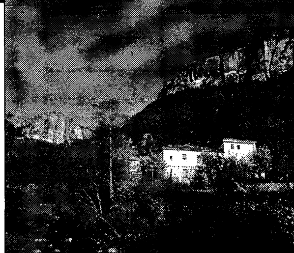
Balneario de Solán de Cabras, en la Serranía de Cuenca