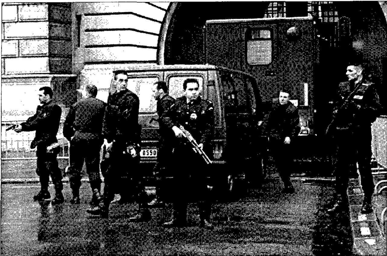
EN SU SITIO Gendarmes franceses custodian el Palacio de Justicia de París, con motivo de uno de los juicios celebrados este año contra dirigentes etarras.