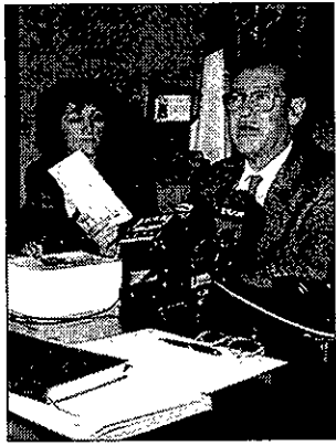
Presentación del libro.