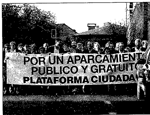
Se abandonarán las acciones en la calle y se acudirá a la Justicia.