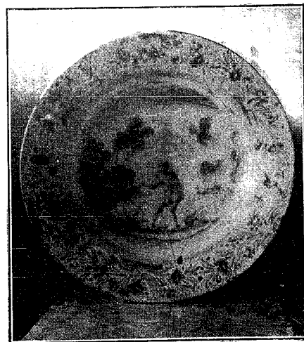
Plato de Talavera

Advertimos a nuestros lectores, que el próximo número, se suprime por no trabajar durante estos días de feria en los Talleres, lo que compensaremos en el del día 18.