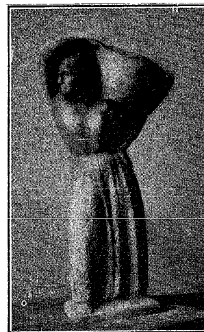
Aldeana por E. Pérez Comendador