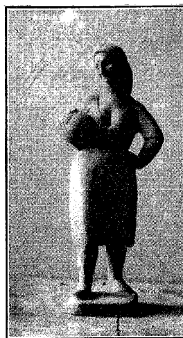
Aguadora, por E. Pérez Comendador