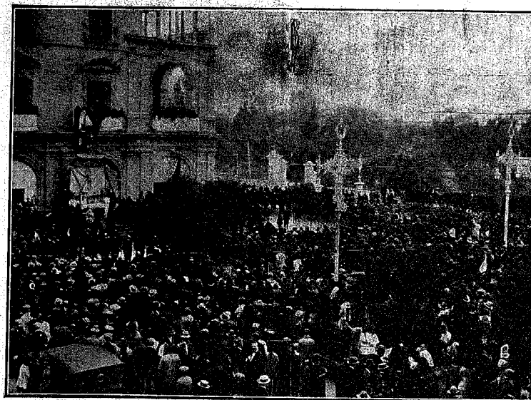
MURCIA.--Aspecto del paseo de la Reina Victoria, durante la bendición y entrega de la bandera por el señor Obispo de la Diócesis a las fuerzas del Somatén.