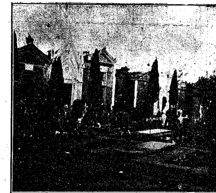
ALBACETE.--El día de los Santos.--He aquí un rincón del Cementerio. Acaso sea el más severo. Así lo dicen estos panteones familiares, capillas donde se venera toda una tradición hidalga...