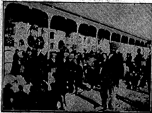
ALBACETE.--El día de los Santos.--Ante los nichos de la nueva galería, los deudos y los desconsolados se agolpan, retocando los adornos, los últimos detalles. El visitante se detiene un momento, marchándose, confundido con la muchedumbre doliente.