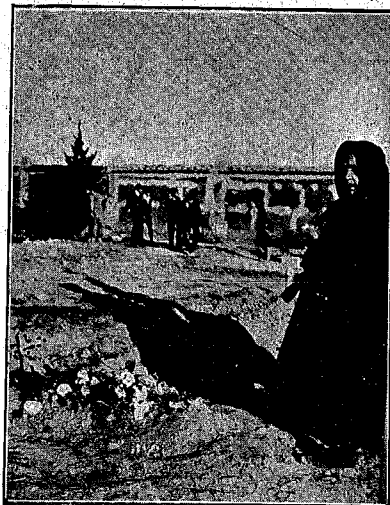
ALBACETE.--El día de los Santos.--El objetivo de «Centauro» ha sorprendido una silenciosa escena de dolor. Ante una tumba, anónima para todo el mundo, esta pobre mujer ha rezado profundamente... ¿Un hijo? ¿El marido? Ella y la tierra saben qué hay allí debajo...