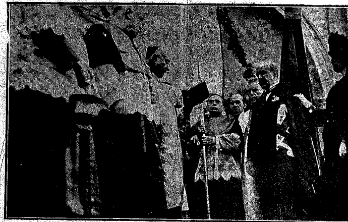
MURCIA.--Acto de bendecir la bandera de la que fueron padrinos los señores Conde de Falcón.