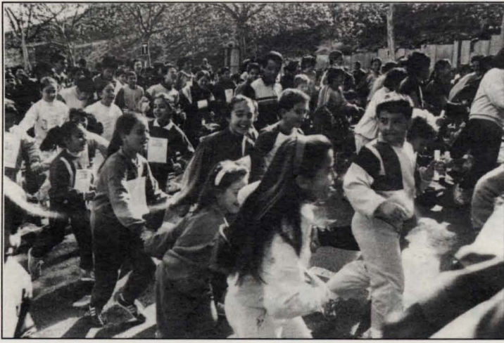
Caminata Popular del pasado año.