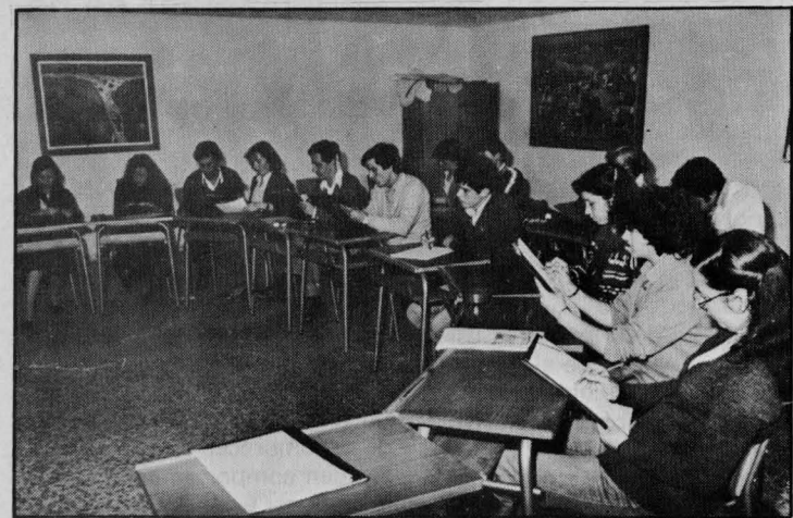
Alumnos del Curso de Dibujo de la Universidad Popular, en una de sus prácticas

— El concepto de educación permanente de adultos con el principio de suministrar todos los medios necesarios para satisfacer las inquietudes y los deseos culturales que el hombre y la mujer de Puertollano, por ahora, más tarde de la Comarca, tengan y demanden.