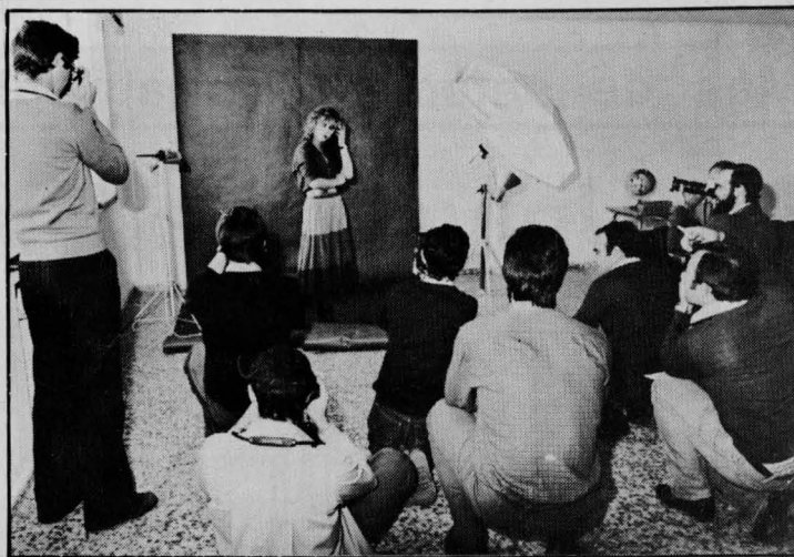
Alumnos del Curso de Fotografía de la Universidad Popular en un momento de sus prácticas

En los días sucesivos fueron empezando los diferentes cursos, hasta cubrir la cifra de 40 que se están dando en la actualidad. El primer contacto con los asistentes se plantea como una discusión abierta sobre los temas a tratar en el curso, metodología a emplear, horarios más idóneos para los asistentes etc., etc. De esta forma se establece una enseñanza abierta a las aportaciones de todos, no rígida ni formalista, en la que importa tanto lo que se aprende en sí, como la convivencia y el diálogo que se genera entre todos; la inter-relación profesor-alumnos y la ausencia total de métodos coercitivos para el aprendizaje (exámenes, pasar lista, notas, etc) con lo que el único elemento que mueve al asistente es el deseo de aprender y aportar a los demás y no aspiraciones de otro tipo.