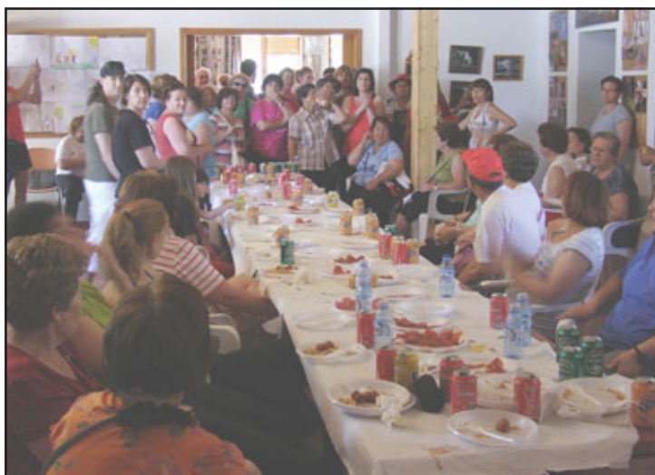
Refrigerio en Peralvillo para recuperar fuerzas

En la web municipal, www.miguelturra.es , se adjunta el folleto con el listado completo de los cursos de: iniciación, matronatación, adultos y perfeccionamiento así como la descripción, tarifas y horarios de cada uno de ellos en formato PDF para ser cómodamente descargado en su ordenador.