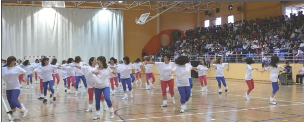
Las exhibiciones en el Pabellón reunieron a cerca de 300 mujeres en la pista, seguidas por numeroso público que pobló las gradas al completo.

Una vez finalizados los talleres, a partir de las 14:00 horas se producía uno de los actos más esperados de la jornada: el encuentro con Ana Díez Fernández, deportista invitada en esta edición. Díez es desde el 2007 árbitro en la federación territorial de Castilla La Mancha y árbitro nacional de