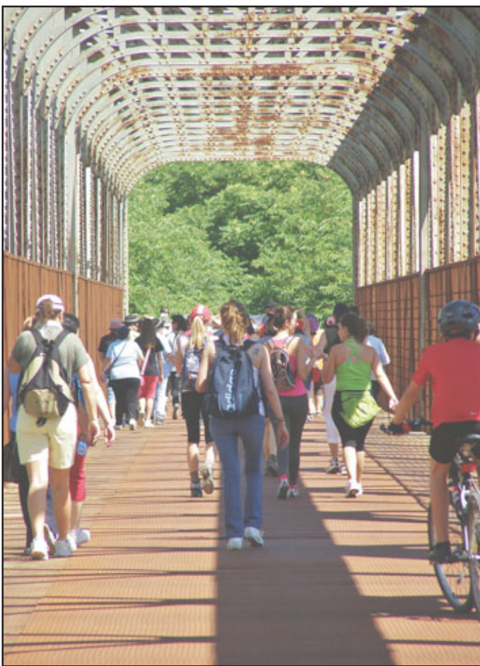
Ruta de senderismo por Peralvillo

La organización de las Jornadas corría a cargo del Patronato Municipal de Deportes y el Centro de la Mujer, con la colaboración de la concejalías de Cultura y Bienestar Social, Asociación Clara Perlerina, Gimnasio Airun, Centro Social, Universidad Popular, asociación «Correcaminos», asociación de Empleadas de Hogar, asociación de Viudas «Nuestra Señora de la Estrella», la agrupación de Voluntarios de Protección Civil, y Diputación Provincial.