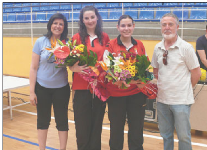
Las árbitros de balonmano fueron las deportistas invitadas