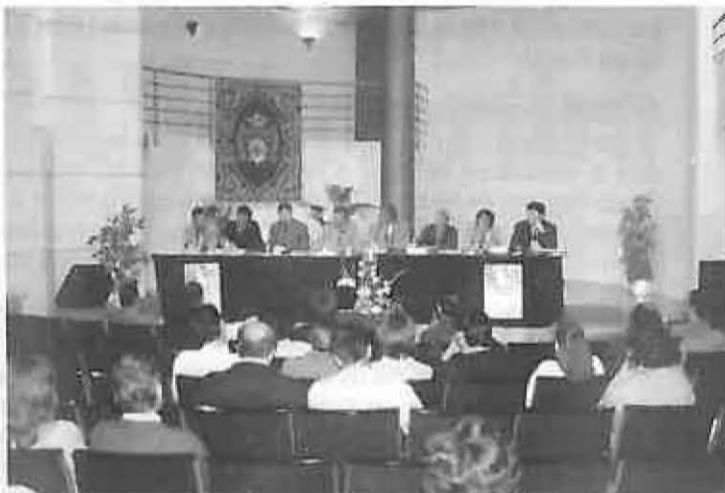
El director general de Deportes participó en las Jornadas de Medicina Deportiva.