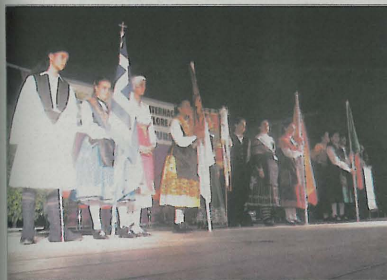
Grecia, Portugal y España formaron el cartel de esta edición

Danzas de Portugal y Grecia amenizaron la noche de Miguelturra junto con las actuaciones del grupo Nazarín, el anfitrión del festival.