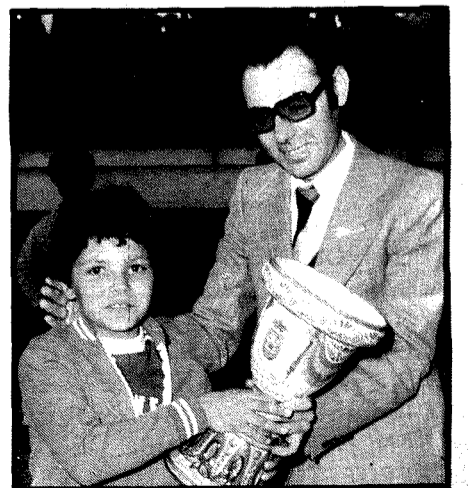
El representante del Fernando de Rojas recoge el Trofeo de Ferias.