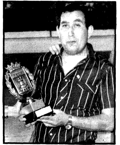
Trofeo del Ayuntamiento al Delegado de la Juventud. (Fotos Rodríguez).

Tras los partidos se procedió al desfile y entrada en la pista de todos los equipos participantes, con más de cuatrocientos muchachos que se fueron situando frente a la presidencia, bajo los sonos de las marchas deportivas, para seguidamente