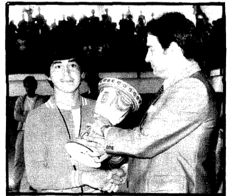
En alevines triunfó el equipo de "Los Joyeros".