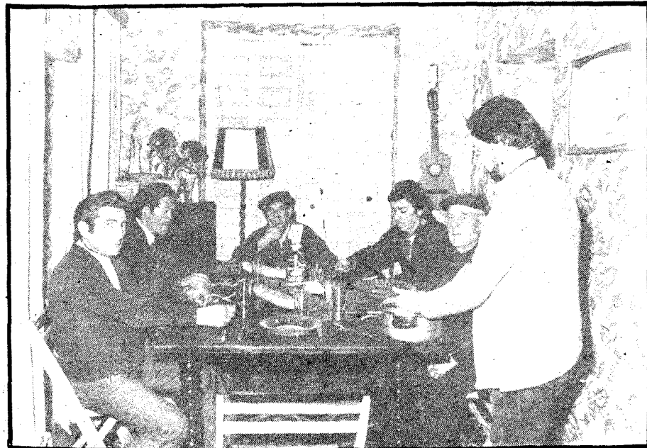
Los miembros del Hogar se sientan a comer.

—Yo pienso que ante una obra social de tal categoría los talaveranos debíamos colaborar eficazmente con vosotros, pues todos somos de alguna manera responsables de situaciones como las que vosotros queréis atender. Por tanto, nos