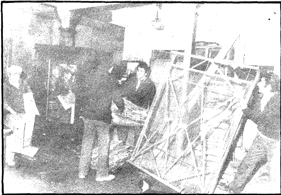
El trabajo de los "traperos" es duro: recoger lo que la sociedad tira.

● Recogen todo lo inservible y con ello ayudan a vivir a muchos pobres.