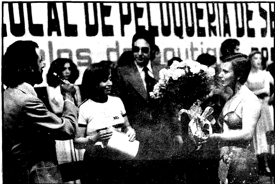
Entrega de trofeo a la representante de Madrid.