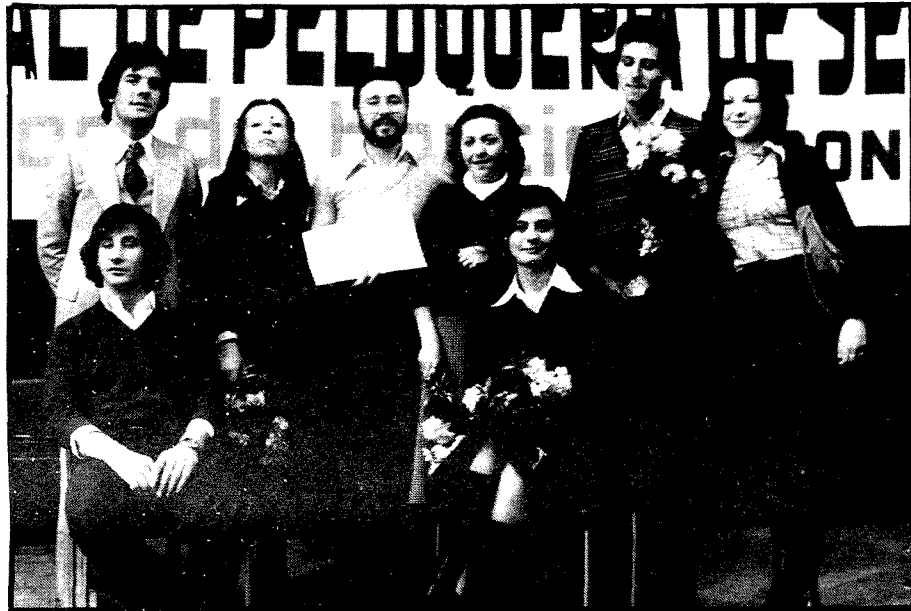
Conjunto de Lagartera que amenizó el acto.