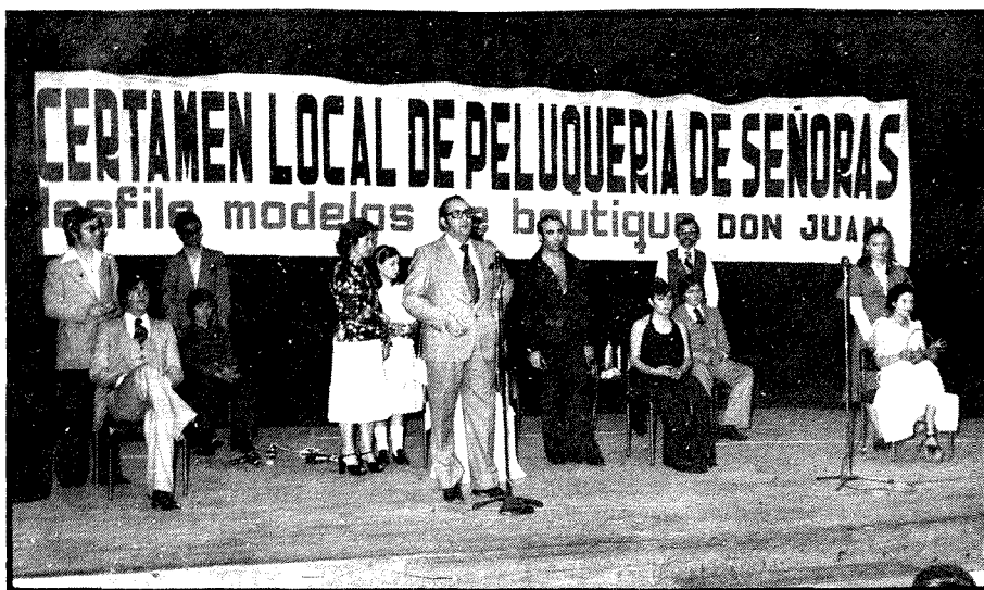
El equipo de peluqueros de señora de Talavera.