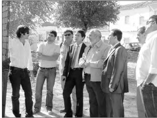
La Junta de Castilla-La Mancha invierte 84.000 euros en un taller de empleo específico