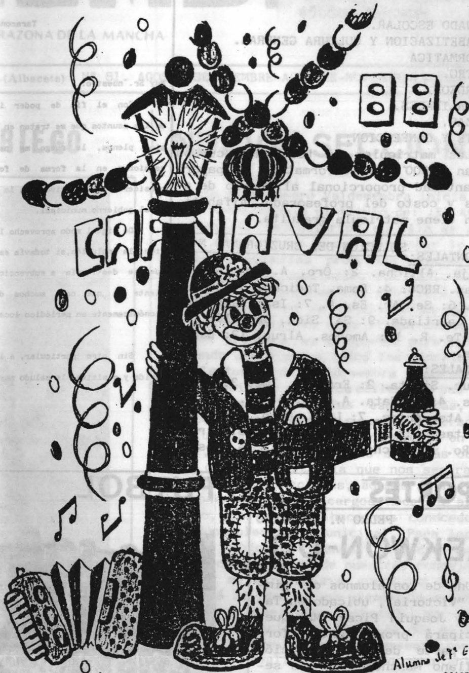
Alumno de 7º E.G.B. MANCHA

CONVOCA: COLEGIO PUBLICO "EDUARDO SANCHIZ". TARAZONA DE LA