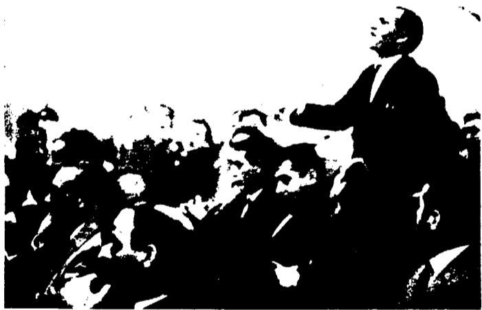
Los representantes sindicales tienen la voz fuerte y la palabra viva.

sindicatos, y cerrar con algún otro comentario.