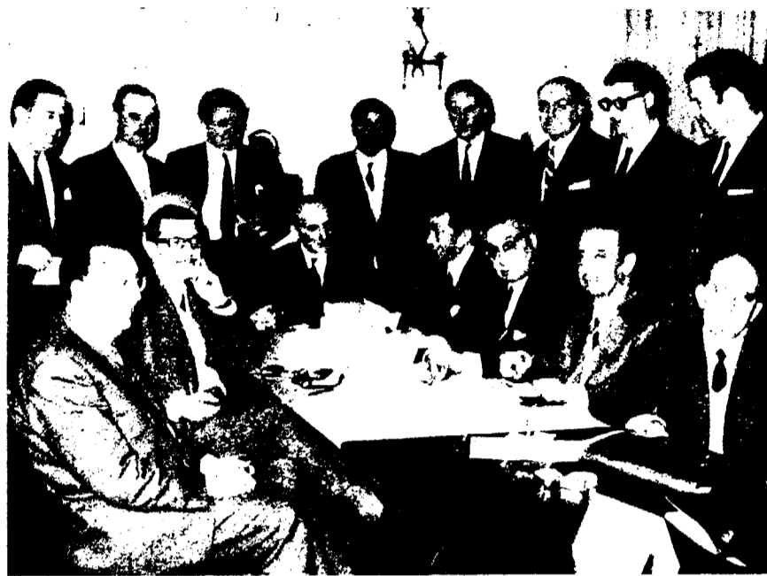
El «espíritu de Pamplona» parece encontrar dificultades.

La oposición de los trabajadores al techo salarial del 5,9 por ciento ha sido unánime. El Con-