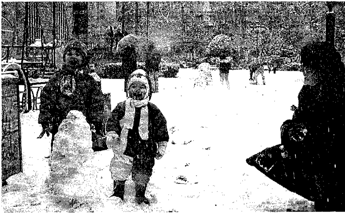
El parque de San Julián congregó a los más aficionados a los muñecos de nieve...