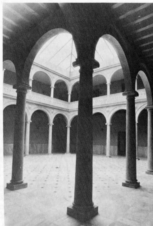
Centro Cultural «La Asunción», antiguo convento hoy habilitado para acoger en sus instalaciones conciertos, muestras, conferencias y diversas actividades.