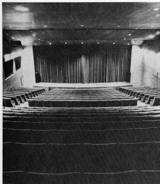
Auditorio del Ayuntamiento de la ciudad, escenario de conciertos y representaciones teatrales.