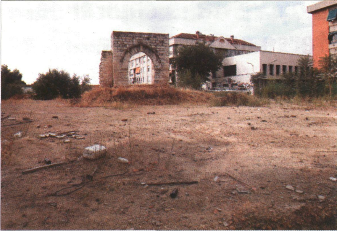
El Ayuntamiento desea resolver la limpieza y el vallado del parking del Torreón a partir de la próxima semana.