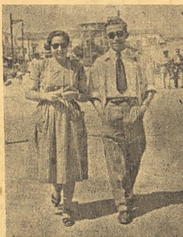
ARROYO PASEA CON SU NOVIA POR LAS CALLES DE ALMAGRO

—Corcha, el del filial del Manchego. Es verdaderamente peligroso.