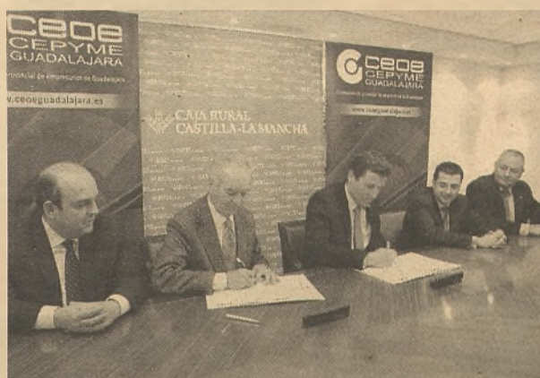
Momento de la firma en la sede de Caja Rural en Guadalajara.

Guadalajara en su 36 Asamblea General; el III Workshop y Encuentro