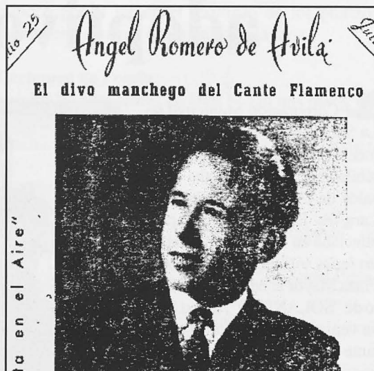
Cartel anunciador de “Angelillo”, años 40.