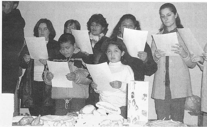
Momento de la fiesta convivencia celebrada en la Casa de la Iglesia.

La Semana de la Interculturalidad ha sido un ejemplo de convivencia y un recordatorio de que el último objetivo de los inmigrantes es volver a su país.