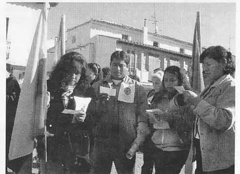
Inmigrantes en la congregación en la Plaza.

su situación, “sabemos que viven en casas en muy mal estado, pagando alquileres muy caros y hay gente que se mete con ellos y dicen mentiras sobre ellos”.