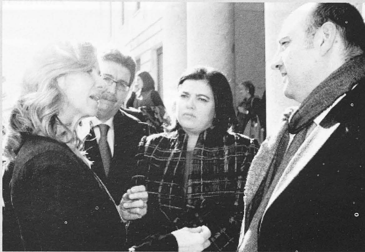
La delegación solanera habla con la ministra Garmendia.

Hasta ahí, sentimos sano orgullo y una inyección de autoestima. Pero la cuestión es saber qué provecho nos reportará en adelante. El Minis-