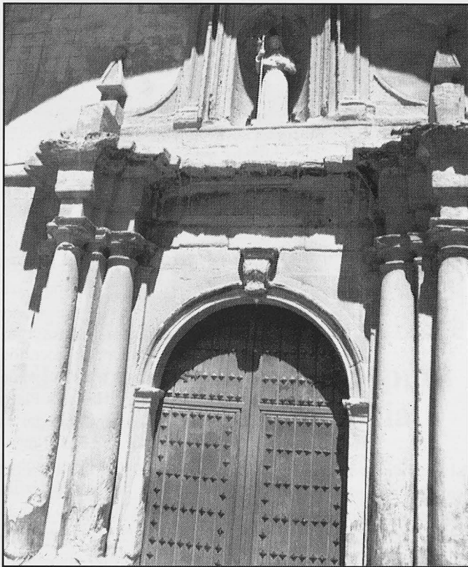
El Pórtico que mira a la Puerta del Sol se encuentra en este lamentable estado.

Sin embargo, la aportación municipal, por muy alta que sea, sólo supondría un pequeña parte. Está claro que el llamamiento popular es el que tendrá que dar el impulso económico, y también moral como perfecto elemento de presión a las administraciones para llevar a cabo el fin propuesto. Mientras todo esto sucede, Santa Catalina sigue gritando socorro.