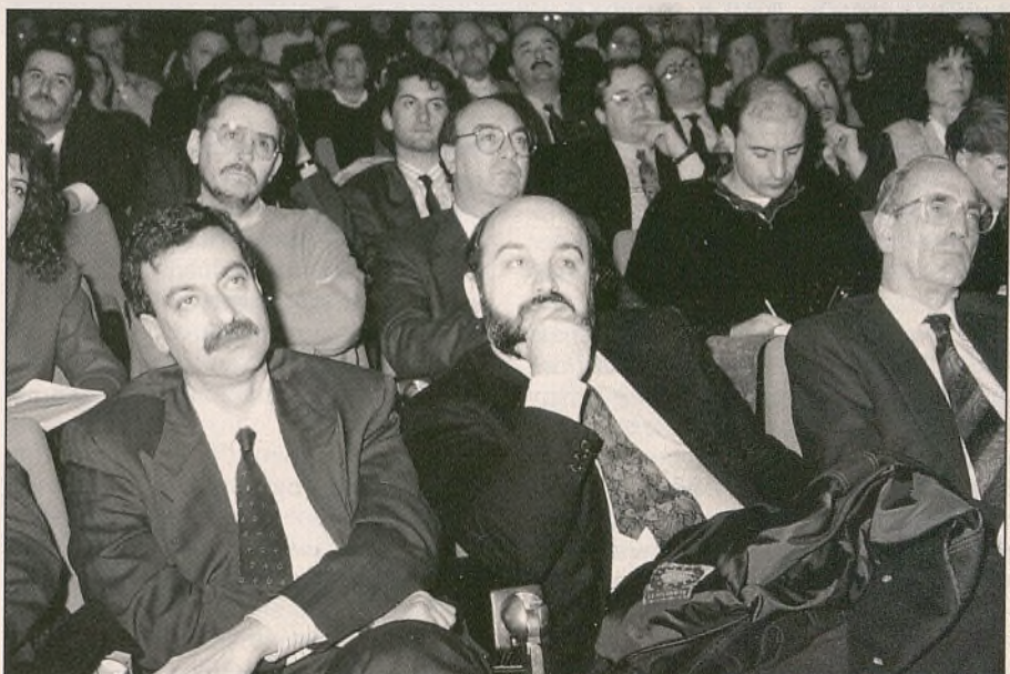
El ex ministro Joaquín Almunia fue otro de los destacados dirigentes socialistas que asistieron.

La ética en la política fue punto común en todas las intervenciones, en la de Javier Solana –mitin completamente electoral– en la de Bono y en la de Narcís Serra.