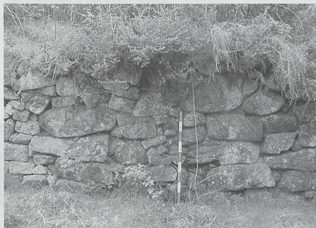
Figura 5. Muralla del Castro de Penalba, Pontevedra

de antenas, por ejemplo, en vez de espadas) (Fig. 3). Las armas de la Edad del Bronce eran propiedad individual y se empleaban de forma individual, seguramente en duelos de estilo heroico como los descritos en la Iliada—en realidad una práctica guerrera extendida por toda Europa entre finales del segundo milenio e inicios del primero a.C. Las murallas no son propiedad individual ni se pueden emplear de forma privada: las tiene que construir todo el grupo y se usan por parte de ese mismo grupo en su autodefensa. Las fortificaciones castreñas, por lo tanto, nos dicen más de lo que parece a primera vista: nos dicen que está cambiando la forma de guerrear (frente a duelos ritualizados e individuales, una lucha más defensiva de toda la comunidad), que está cambiando la organización social (en la que el grupo tiene más