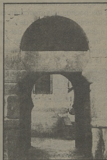
El Reino de León y Castilla bajo el Rey Alfonso VI (1065-1109)