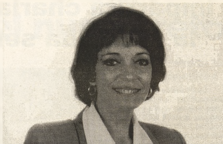
Josefa Babiano Alcaldesa de Almadén y diputada nacional

Josefa Babiano, a cuya toma de posesión acudió acompañada de su esposo e hijos, llega al Congreso dispuesta a aprovechar estos pocos meses de