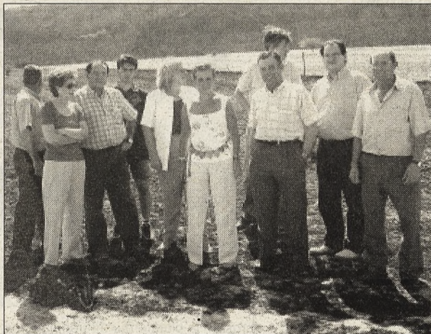
Diputados del Partido Popular visitaron Saceruela