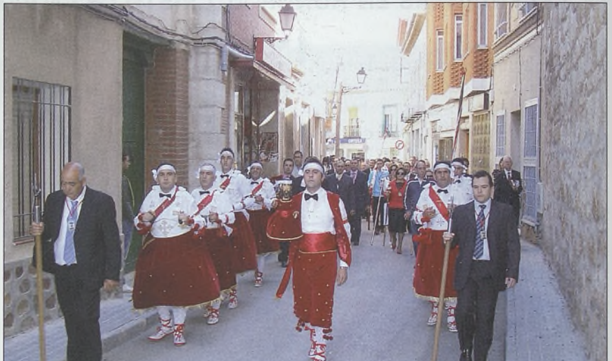
En Villacañas, los danzantes del Cristo de la Viga se subastan el 19 de marzo.

El acervo cultural y festivo de la región viene marcado en multitud de ocasiones por el calendario litúrgico: las festividades de Semana Santa y el Corpus determinan también otras fiestas tradicionales, paganas como los carnavales, o religiosas como las octavas del Corpus, entre las que