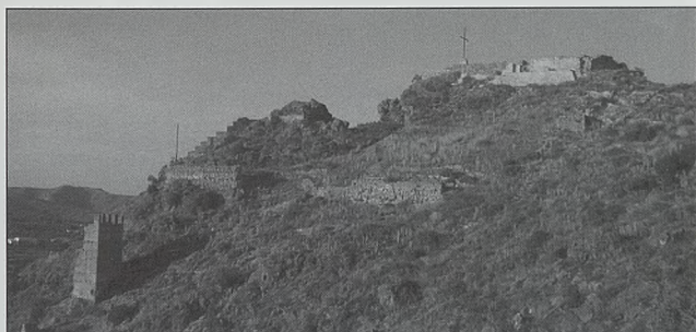
Doble recinto del castillo de Mogente

Se encuentra en una loma dominando la población. El conjunto comprende el castillo propiamente, de doble recinto que conserva tan solo los basamentos de las murallas, un cinturón amurallado con algunos restos de torres que aún conservan sus almenas, y una torre albarrana de vigilancia al otro lado del barranco. El castillo está construido de mampostería y tapial, mientras que las torres de la muralla son de tapial.