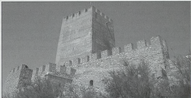
Torre del Homenaje y alcázar del castillo de Bañeres

Ubicado en el centro de la población en lo alto del Tossal del Aguila, a unos 850 m de altura. Presenta un doble recinto escalonado sobre la ladera oriental, pues la occidental es un cortado sobre el que se apoya la muralla.