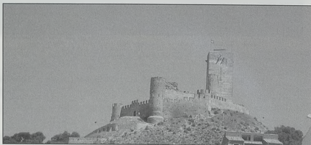
Vista meridional del castillo de Biar

Está ubicado en un cerro de 745 m en el centro de la población. Destaca la torre cuadrada exenta de 19 m de altura, en el interior de un doble recinto escalonado hacia el sur, jalonado por cubos semicirculares, cuatro en el inferior y tres en el superior.