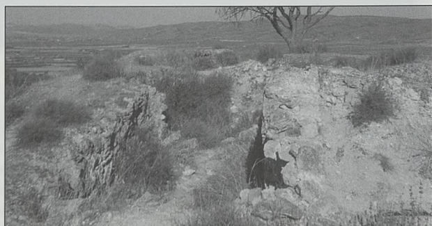
Restos del castillo de Almizra

Se encuentra en lo alto del Cerro de San Bartolomé, a unos 685 m de altura, al sur de la población de Campo de Mirra. Del castillo árabe, solo quedan los basamentos de los muros de tapial con guijarros y rocas, que delimitan un espacio lenticular de unos 25 x 12 m. La importancia de este castillo se debe a que a sus pies se firmó el Tratado de Almizra. De las sucesivas reconstrucciones cristianas perdura la Torre del Conjurador (s. XVI), adosada a la actual ermita.