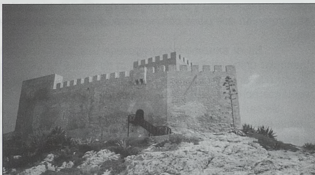
Recinto central del castillo de Petrel

Se encuentra al este de la población, en una loma a 460 m. Existió un doble recinto en la ladera hacia la villa, que presenta una suave pendiente, del que solo queda la muralla frontal occidental, con una torre cuadrada centrada y saliente de tapial.