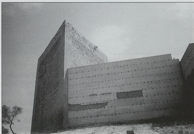
Torre triangular del castillo de la Mola de Novelda